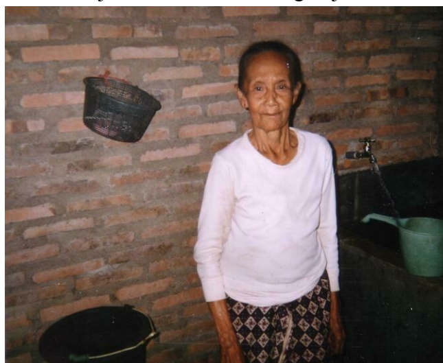
Wat is deze vrouw en haar gezin dankbaar en blij met stromend water!

Het drinkwaterproject voor 50 arme gezinnen in Sendangsono. (Midden Java) hebben stromend water en zijn zeer dankbaar en erg blij!