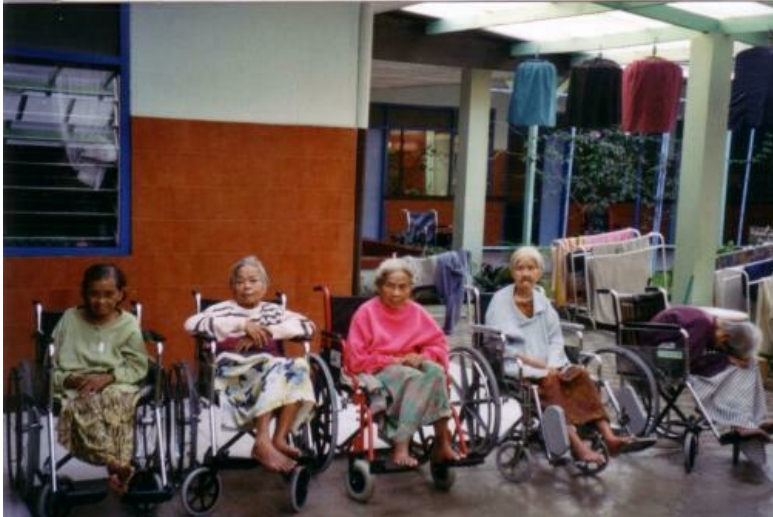
Bejaardenhuis in Cimahi