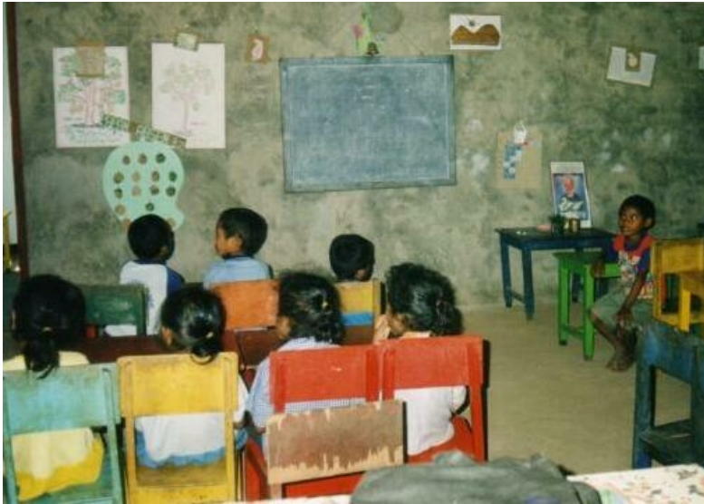
Binnenkant kleuterschool wordt in 2009 geveerd

Wij vertrouwen erop dat deze verantwoording duidelijk maakt dat uw giften en donaties zeer goed besteed worden. Indonesië is een zeer groot land en door de economische crisis zijn er hoge prijzen voor levensonderhoud. Door de aanhoudende regen in het najaar waren er vele overstromingen in Jakarta, Bandung, Yogyakarta, Bali en Flores. Er komen nu minder toeristen waardoor de belangrijkste bron van inkomsten voor de bevolking wegvalt. Wij hopen dat onze trouwe donateurs in 2009 ons mooie werk blijven steunen om de arme bevolking van Indonesië te kunnen blijven helpen! Meer informatie kunt u krijgen bij de redactie van dit jaarverslag.