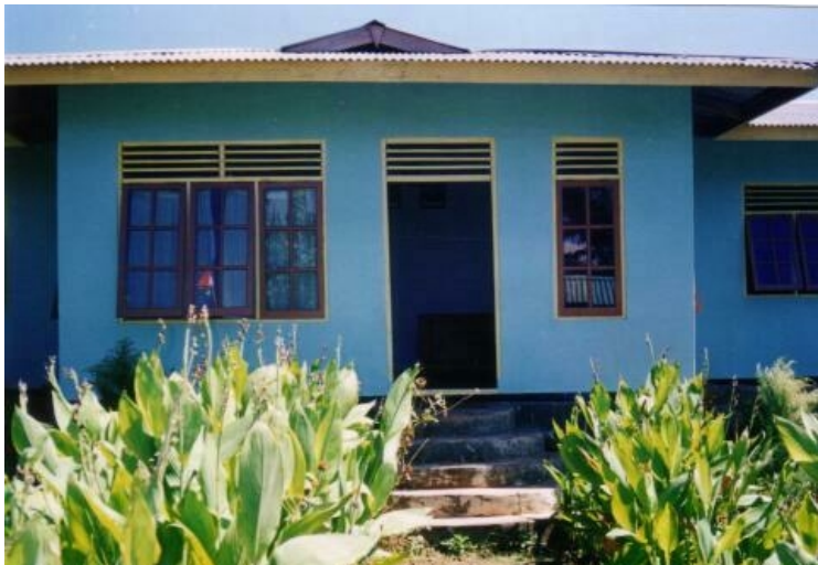
Kleuterschool Riangpuho Flores

De 3 groepen vrouwen "suka maju" in Lewotobi en "suka damai" in Lato en Basira (hier zijn ze een klein winkeltje begonnen met een gift). De eerste twee groepen hebben geld gekregen om een opbergplaats te bouwen die ze nodig hebben voor hun koopwaar. Dit jaar zijn er weer 10 jongens en meisjes die hun schoolopleiding op de SMU kunnen voortzetten of beginnen. Van de vorige groep zijn 4 meisjes en 1 jongen geslaagd voor hun eindexamen.